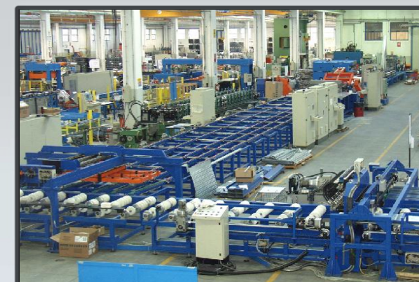
Vista parziale macchina

Linea per produzione cassonetto per porte scorrevoli completa tipo D.