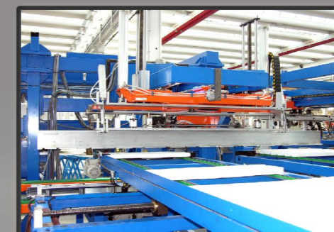
Viste in dettaglio macchina