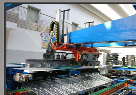
Viste in dettaglio macchina