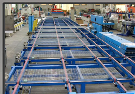
Viste in dettaglio macchina