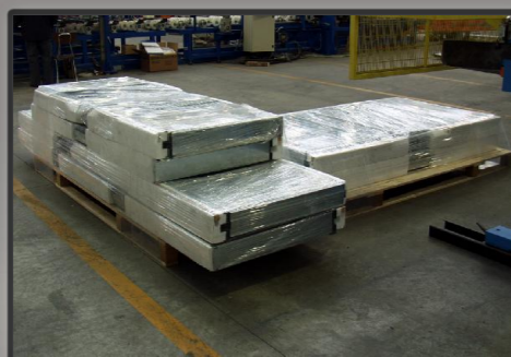
Prodotto finito e imballato