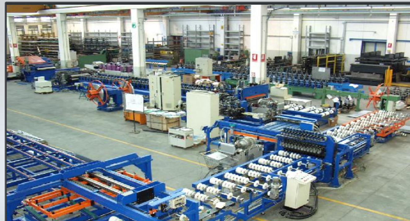
Vista di assieme macchina